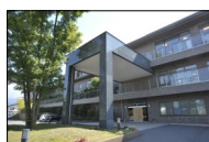
介護老人保健施設 掬水