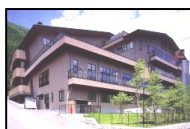
介護老人保健施設 萌生の里